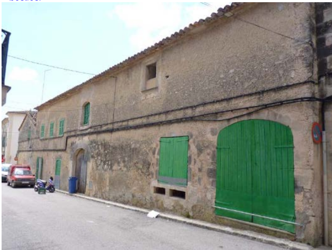
Element U-44, façana del carrer Bellavista

Casa de poble alineada al carrer i situada a una cantonada, formada per dos bucs annexes disposats perpendicularment. El primer, que fa cap de cantó, és una botiga i el segon és l'habitatge i disposa de pati interior. Pel que fa a aquest edifici és de dues plantes i un aiguavés que vessa cap a la part posterior. Els paraments es troben paredats en verd i referits, les cornises són llivanyes de marès i la coberta és de teula àrab. A la planta baixa de l'habitatge trobam el portal forà, d'arc de mig punt emmarcat amb dovelles i carcanyols de marès i brancals i escopidors de pedra; una portassa d'arc carpanell rebaixat, just a devora de l'obertura del celler i dos portals secundaris, un allindat i l'altre escarser. Al primer pis hi ha cinc finestres a diferents alçàries, quatre allindades, una de les quals amb ampit motllurat, i una quinta, la corresponent a la pallissa, d'arc escarser. L'accés al pati es fa a través d'un arc carpanell. Al costat d'aquest arc, hi ha una finestra atrompetada que ha estat cegada. Al pati es troben dependències auxiliars com la soll i la pallissa. A la façana trobam anelles per fermar les bèsties.