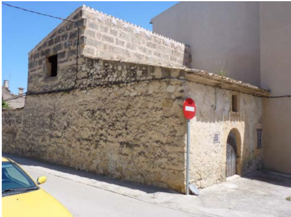
La carrera catalogada es situa davant la façana principal de la casa, a la dreta de la fotografia i ja s'inclou dintre de l'àmbit grafiat per a l'element U-117

La carrera esmentada per a l'element U-117 ja es trobava grafiada i es correspon amb l'espai que presenta un costat de forma semicircular. L'edificació pròpiament dita és l'espai rectangular posterior. S'adjunta fotografia explicativa: